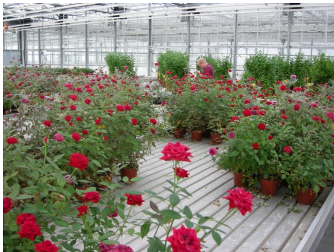
Test Hasten met Milbeknock op potrozen bij Botany B.V. in Horst; SURfaPLUS

Bijde laatste waarneming (drie weken na de laatste behandeling) was de gewasstand minder bij de halve dosering Milbeknock (met en zonder Hasten). Op geen van de vier meettijdstippen is een zichtbaar residu waargenomen.